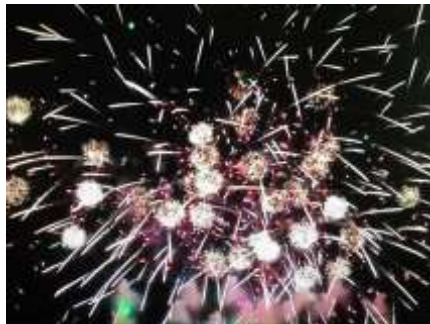
Motýl uvnitř pivoňky Fafalla in Peonia

8x Exploze Titanová detonace 8 Colpo Titanio