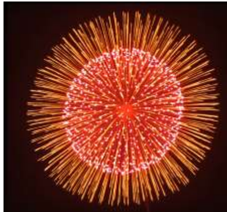
Gold Glitter peony w. Red Pistil