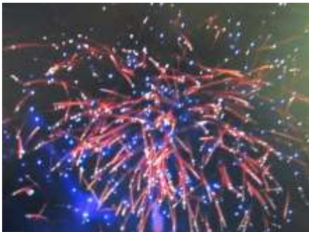
Motýl s modrým středem Farfalla Blu

8x Exploze Titanová detonace 8 Colpo Titanio