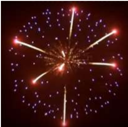
Blue Peony w. Red Coconut pistil