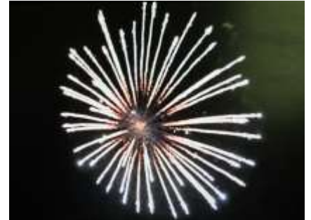
Koňský ocas Coda Di Cavallo