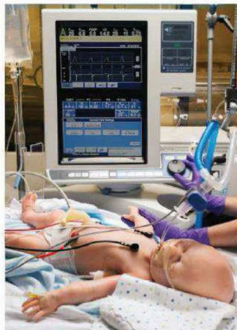
Podpora reálného mechanického ventilátoru a patientského monitoru