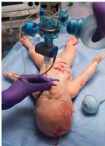
Neonatální resuscitace a stabilizace