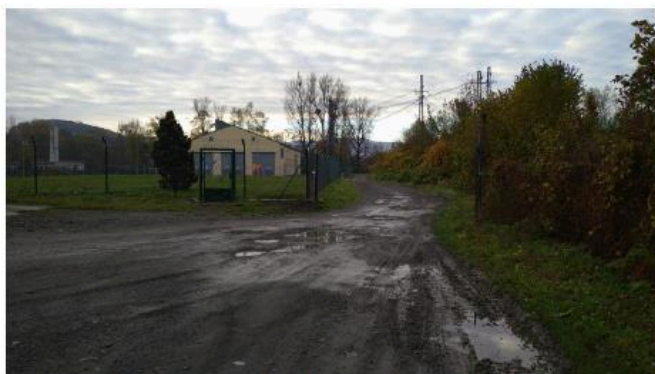
Obrázek č. 2 – příjezdová komunikace – defekty