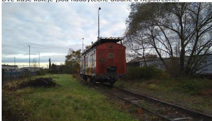
Obrázek č. 3 – vliv klimatických podmínek