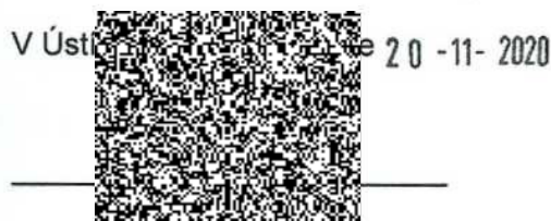
V Ústí nad Labem dne 20. 11. 2020 vedoucí oddělení materiálně technického zabezpečení OSM KŘP-U

POLICIE ČESKÉ REPUBLIKY KRAJSKÉ ŘEDITELSTVÍ POLICIE ÚSTECKÉHO KRAJE POŠTOVNÍ SCHRÁNKA 179 401 79 ÚSTÍ NAD LABEM