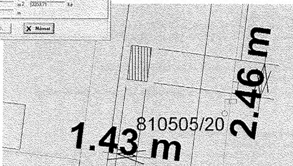
Figura je v tomto případě složena ze čtyř bodů