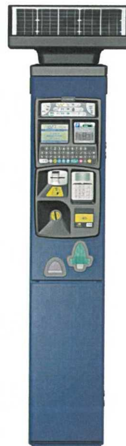
Obrázek je ilustrativní