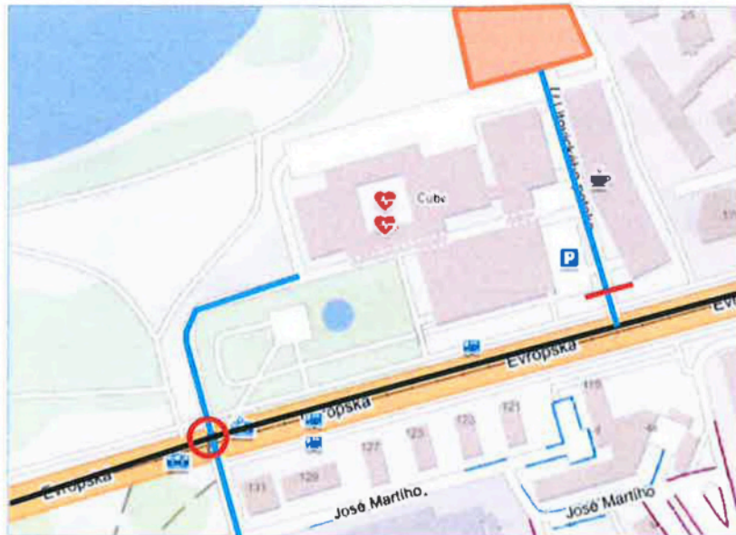
obr. 1 - rozsah řešeného území

Na základě takto zjištěných údajů dopracujeme model současného stavu - výstupem bude kartogram intenzit AD ve skladbě – celkem vozidla za 24h / z toho nad 3,5 t.