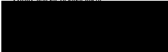
MONETA Money Bank, a. s.