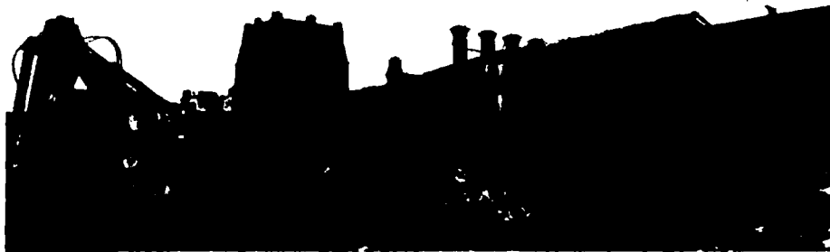
Vyseparovaná kontaminovaná zemina