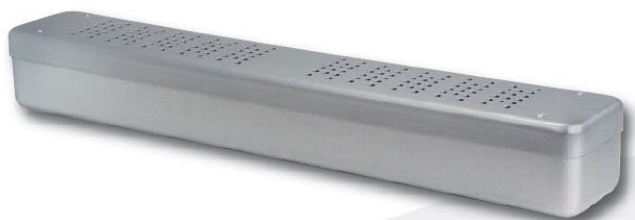
093-375-010 Silikonový držák na optiku do sterilizačního boxu (4ks)