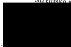
za příjemce Ing. Eva Mündleinová ředitelka

Středisko sociálních služeb Kopivnice, p.o. 60798891 42 21 Kopivnice - 1 -