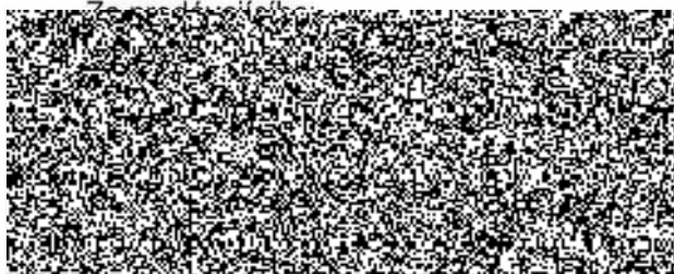
jednatel ARCA s.r.o. podepsáno elektronicky