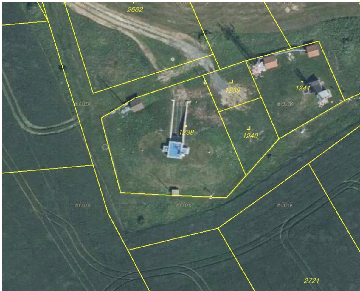
Příloha č. 1 – zakres předmětu nájmu: