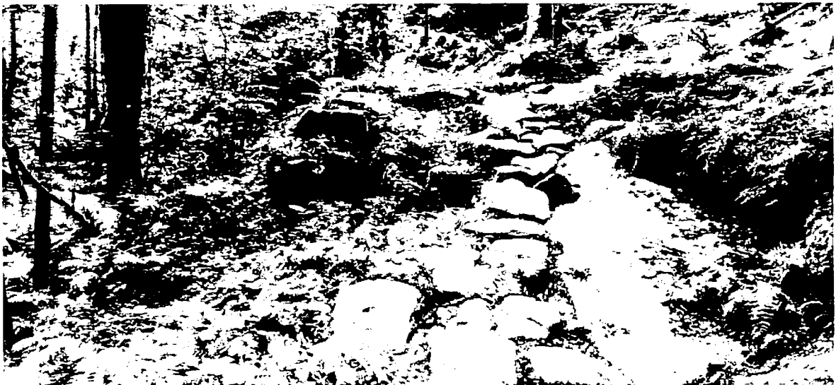
Detail poškozené cesty