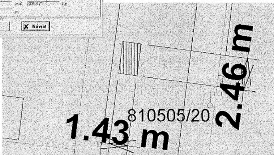
Figura je v tomto případě složena ze čtyř bodů