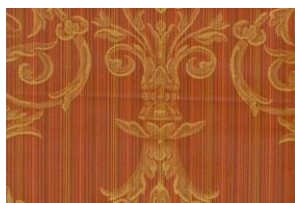
- závěsy, přehozy

Vybrané materiály mají složení 70% PES a 30% BA