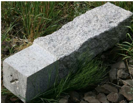
Povrchová kamenná měřická značka M2

Výrobek z přírodního kamene kamenicky opracovaný do tvaru hranolu, určený ke stabilizaci měřických bodů. Pro účel stabilizace bodů primární sítě lze používat povrchové kamenné znaky s označením M2, které splňují požadavky na provedení a rozměry dle ČSN 72 2518.