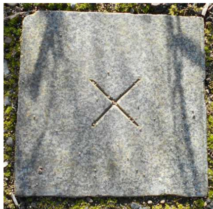
Kámen M2 s vyřezaným křížkem