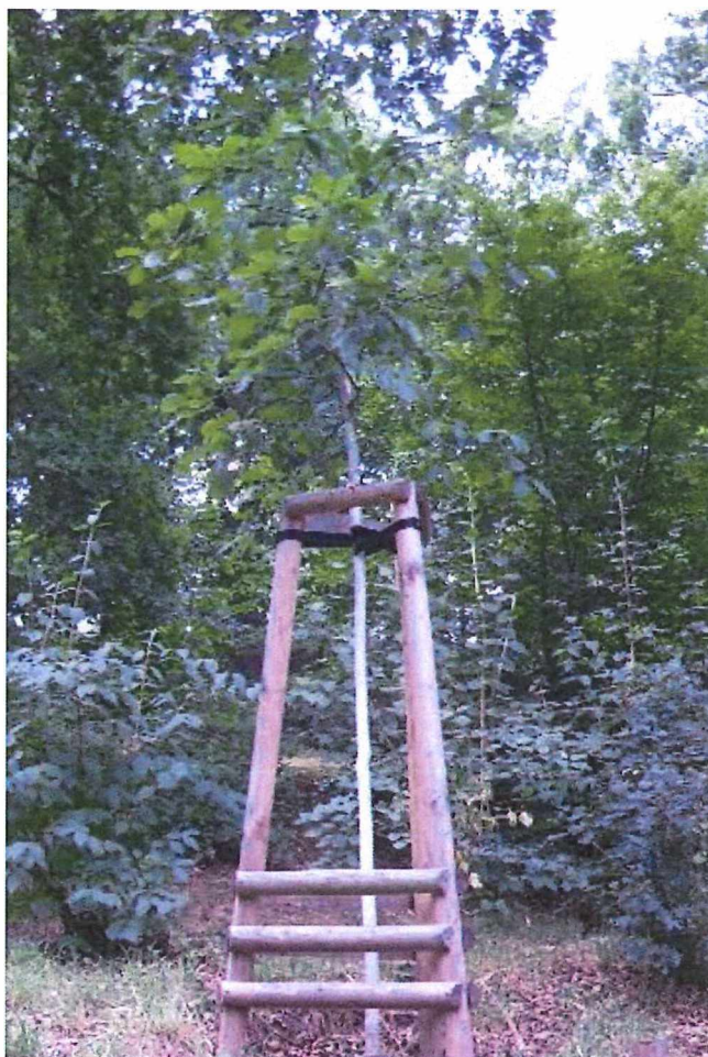
Obrázek kotvení vysazovaných dřevin

Před započítím výkopových prací je nutné vytýčit inženýrské sítě. Hloubení výsadbové jámy v okolí inženýrských sítí je nutné provádět ručně.