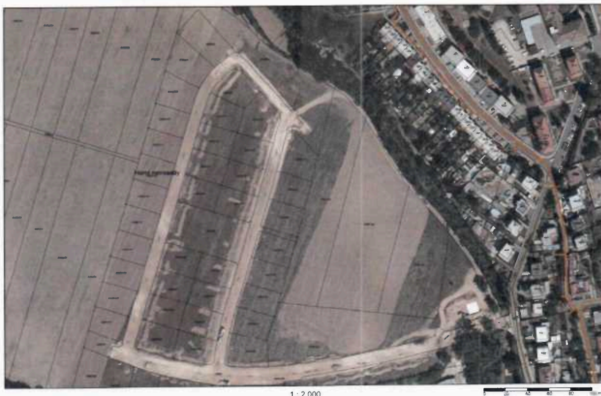
Obrázek č. 1 - Předávací místo č. 1 MK Novosady