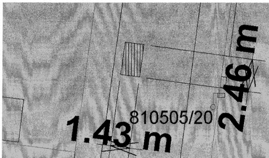
Figura je v tomto případě složena ze čtyř bodů