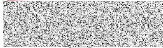
razítko a podpis prodávajícího