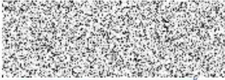
razítko a podpis kupujícího