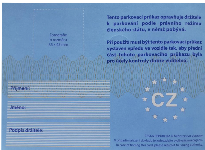
Obrázek 2: Zadní strana