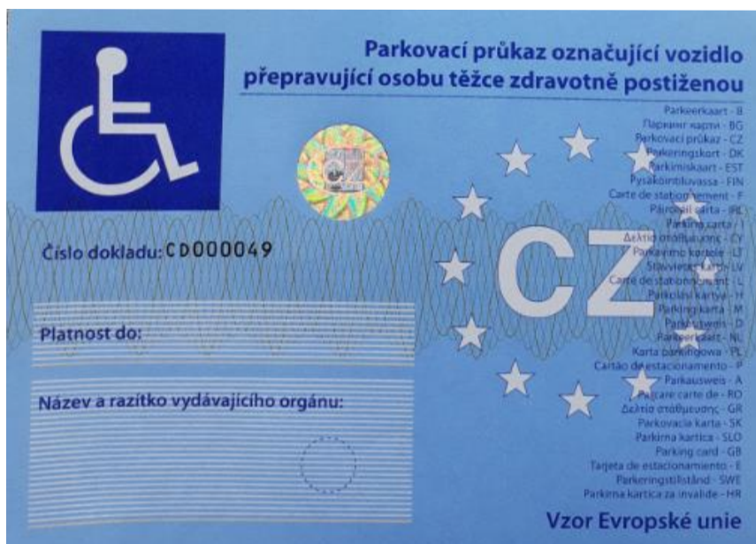
Obrázek 1: Přední strana