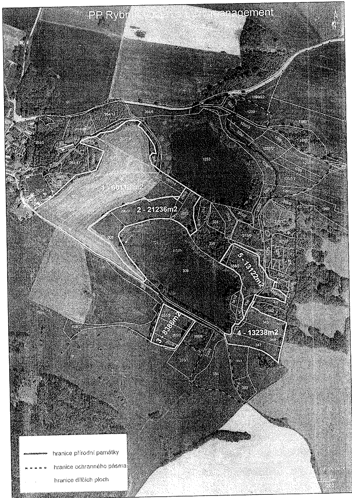
Příloha č 2: