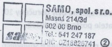
Osoba jednající za kupujícího Razítko a podpis kupujícího

Základní škola a praktická škola Brno, Vídeňská, příspěvková organizace se sídlem Vídeňská 244/26, 639 00 Brno IČ: 449 93 633