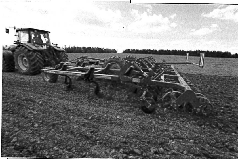
Radličkový podmiítač Terrano FM – výrobce HORSCH Německo

Radličkový podmiítač Terrano FM je použitelný nejen pro přesnou, mělkou podmiítku, ale i pro intenzivní kypření celého profilu ornice. Dokáže promísit půdu až do hloubky 30 cm. Má velkou průchodnost a to je užitečné pro zapracování značného objemu posklizňových zbytků. Radličky jsou uspořádány ve čtyřech řadách, výsledná rozteč je 28cm. Terrano FM používá pracovní jednotky TerraGrip II. generace, které jsou bezúdržbové a díky svojí tuhosti 570 kg zaručují přesné dodržování pracovní hloubky. Součástí stroje jsou také nezávisle zavěšené talíře jištěné proti přetížení. V nabídce je také několik drobných pýchů, hydraulické nastavení hloubky a řada dalších věcí.