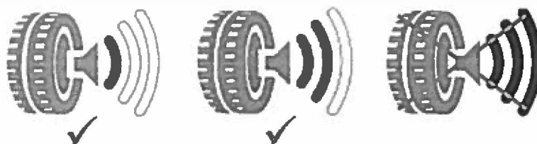
obr. č. 2