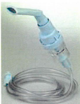
SideStream sada sv.modrá (hadice + sv.modrá vyvařovatelná nebulizační nádobka+sv.modrý vyvařovatelný náústek) Hadici nemáčet!

1102088 InnoSpire sada náhrad. filtrů pro kompresor.inhalátor - 5ks 57,- 69,-