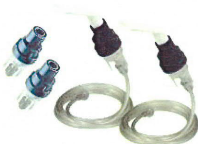
SideStream nebulizační nádobky tmavě modré; SideStream sada „disposable“ (tm.modrá nebulizační nádobka+hadice+bílý náústek) Hadici nemáčet!