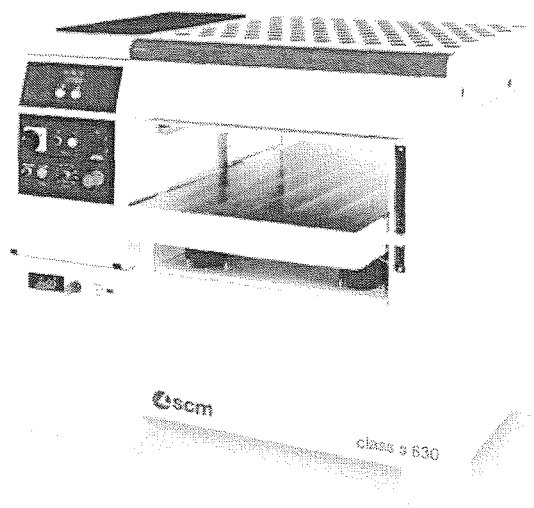
ilustrační foto stroje