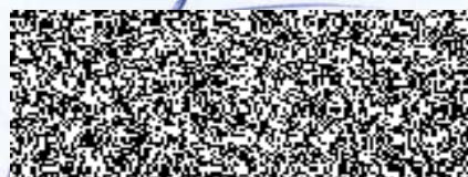
Martin Žampach (zhotovitel)