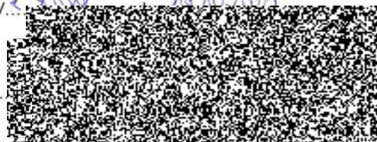
jednatel (za Zhotovitele)