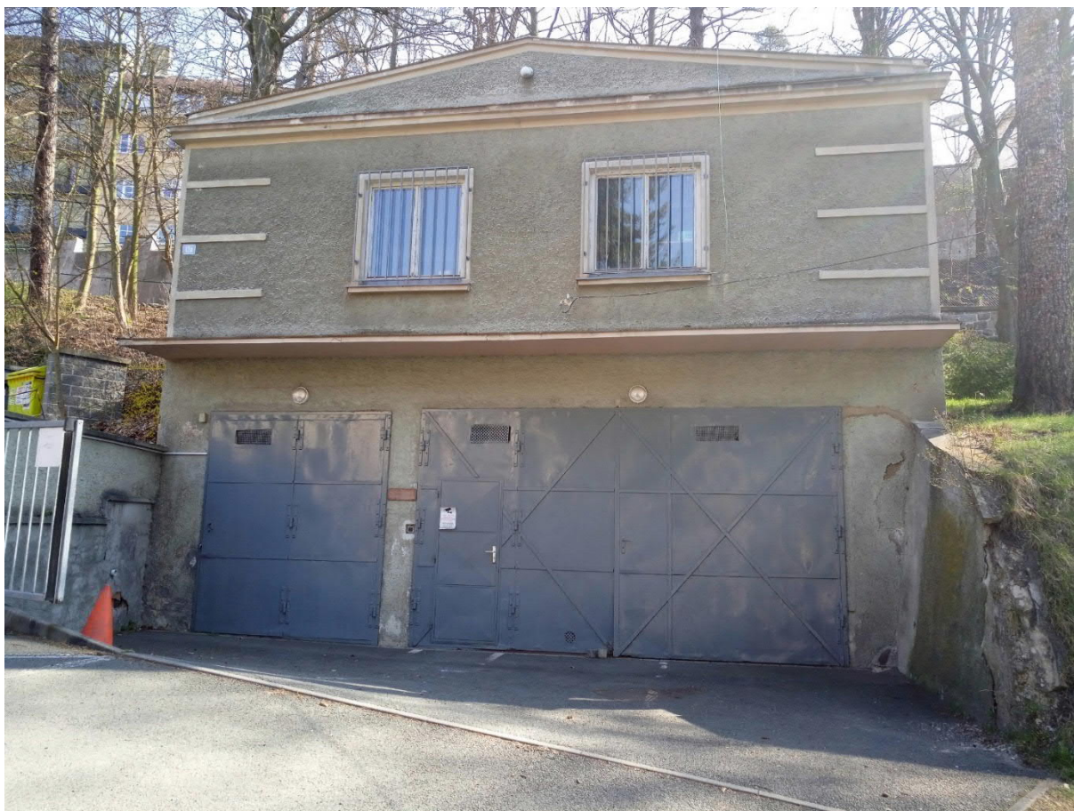
Obrázek 1- Stávající stav

Aktuálně osazeno plechovými garážovými vraty usazenými v železných zárubních. Větší vrata jsou zpříčená a není možné dále užívat.