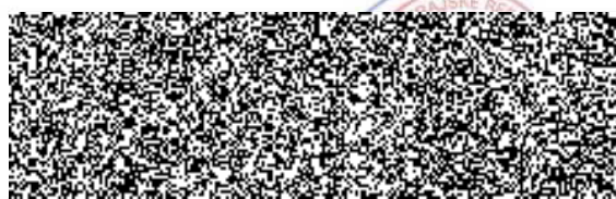
náměstek ředitele pro ekonomiku KŘP Olomouckého kraje