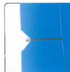
postranní vypínací systém