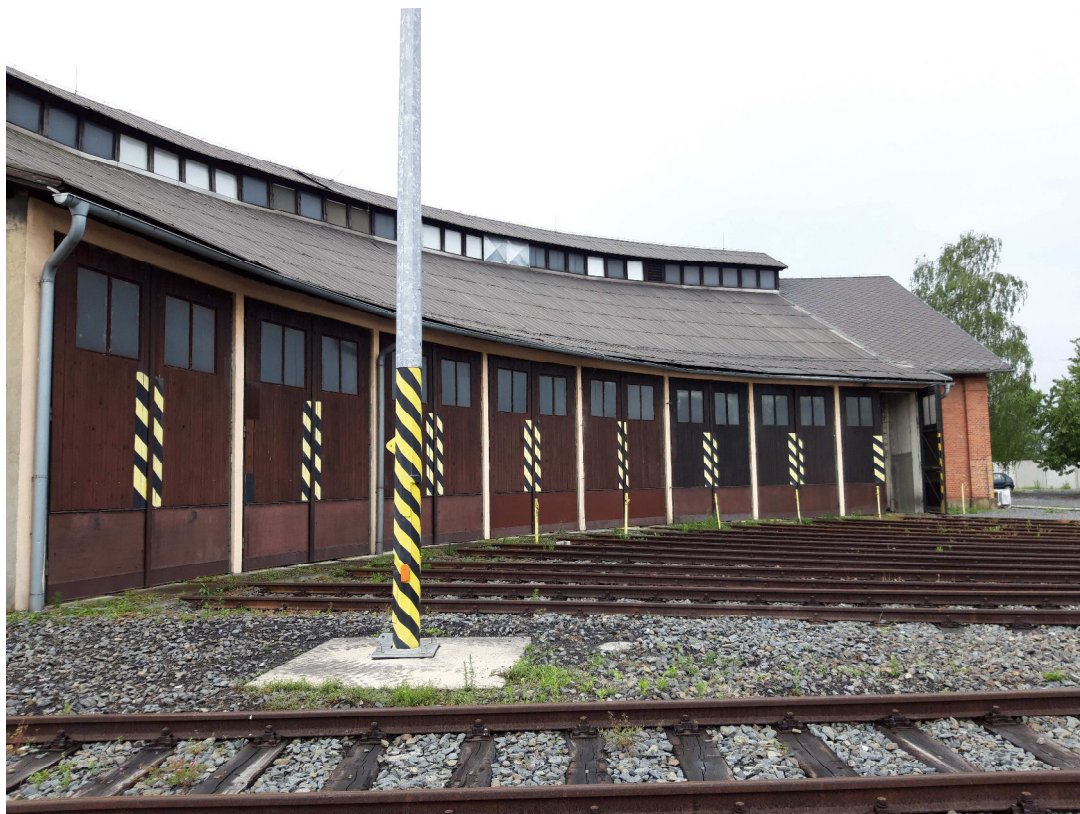
Pohled na kruhovou rotundu KBD