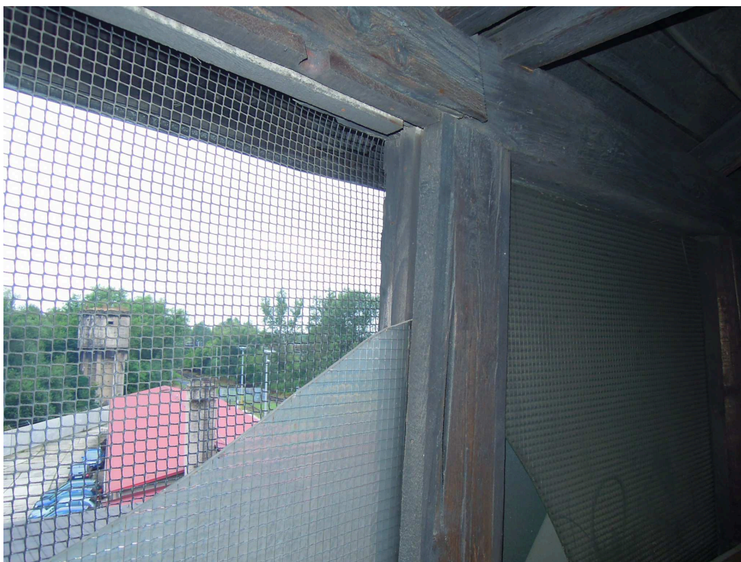
Poškozená výplň vikýře