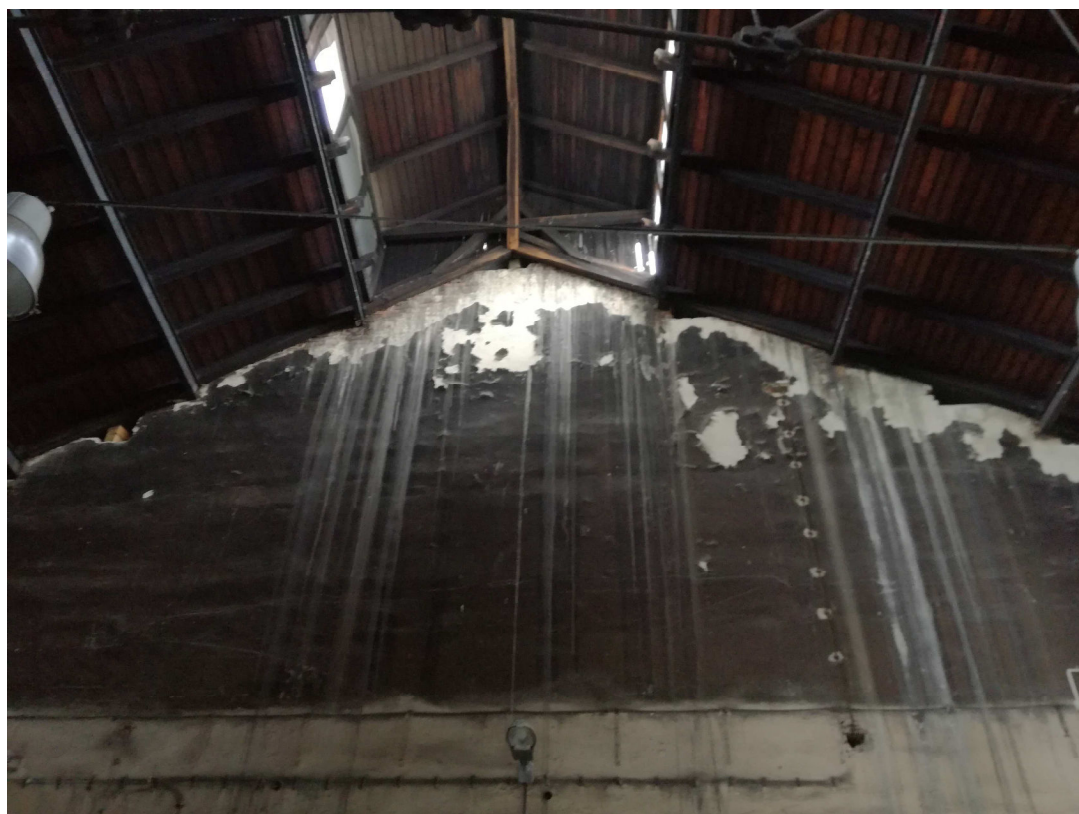
Poškozené omítky na štítové stěně kruhové rotundy