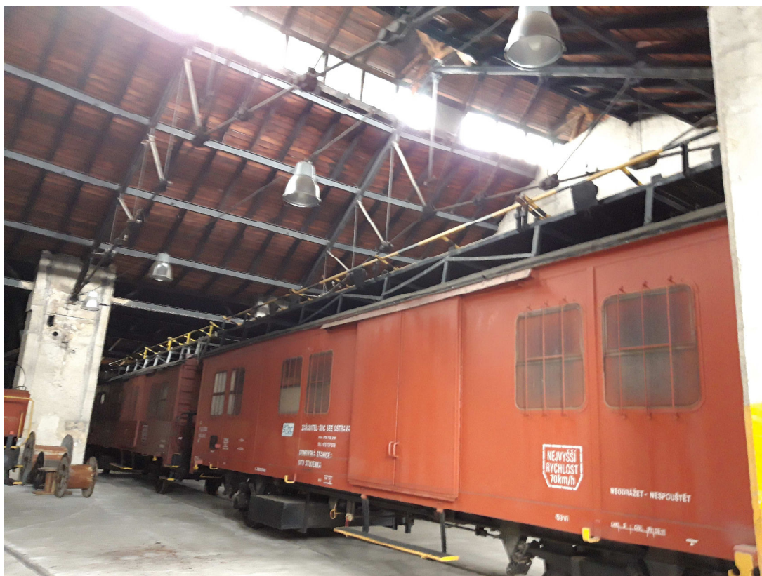
Objekt slouží pro stání drážních vozidel