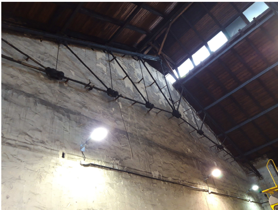
Stávající ocelová příhradová konstrukce