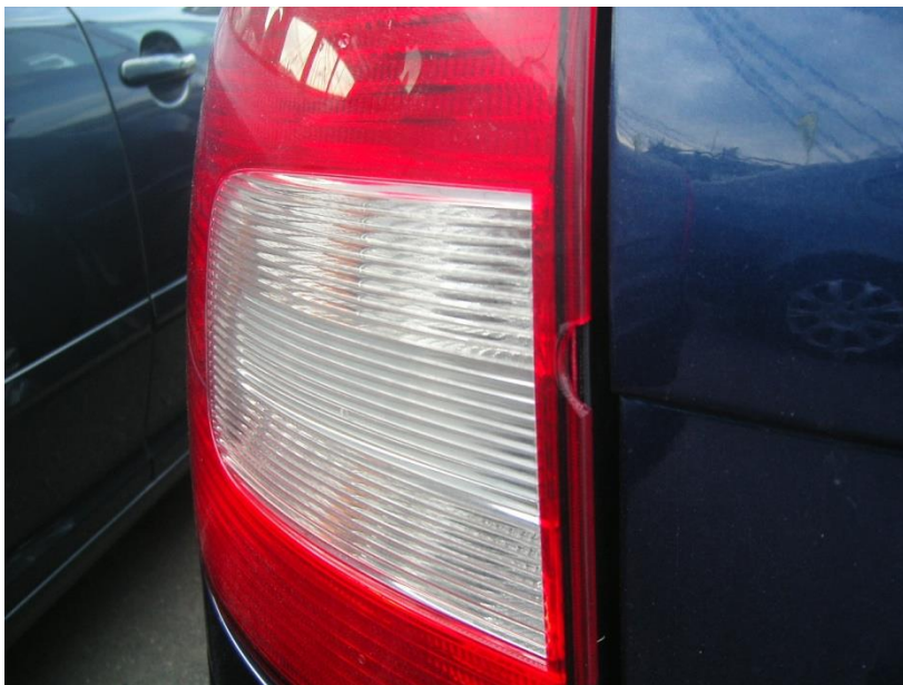
- Promáčklina karoserie