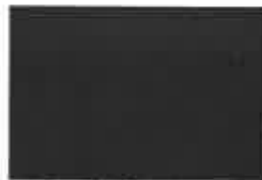
Odbor pozemních komunikací