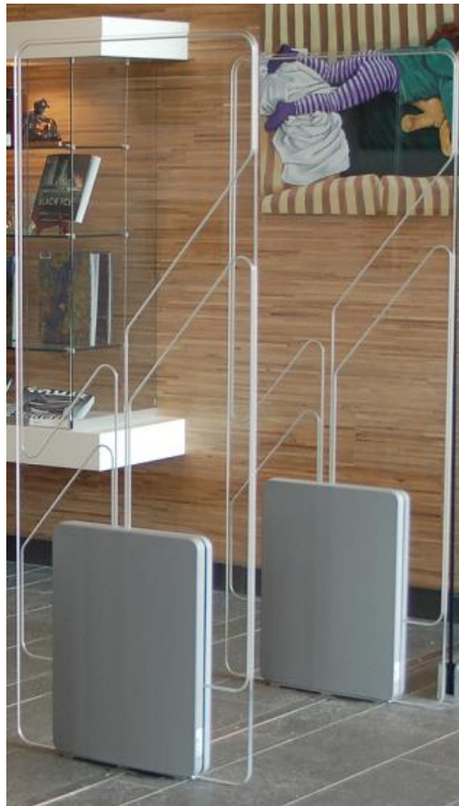
RFID bezpečnostní brána s jedním průchodem