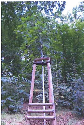
obrázek kotvení vysazovaných dřevin