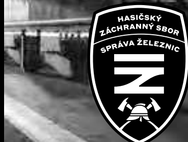
znak na fotografii