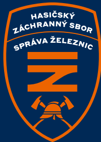
znak na modré ploše