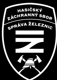
znak na černé ploše