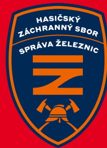
znak na červené ploše