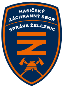
základní barevné provedení