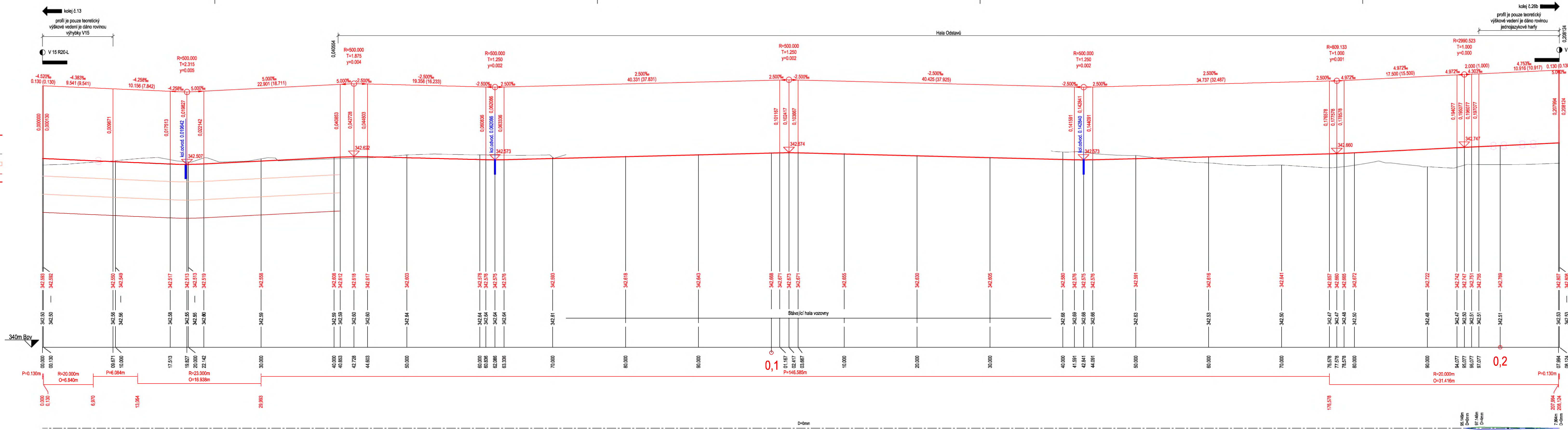
Kolej 12 M 1:250/25 km 0.000000 - km 0.201491

PŘEVÝŠENÍ KOLEJE: LEVA KOLEJNICE PRAVA KOLEJNICE OSA KOLEJE