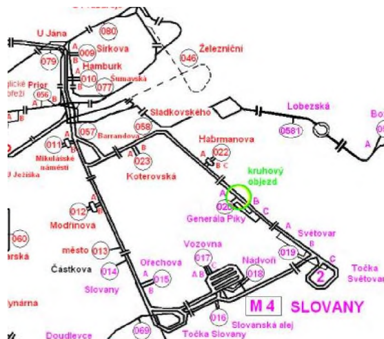
Obr. 1 Část schéma napájení měření

Při návrhu ochranných opatření se postupuje v souladu s ČSN EN 50122-2, ed.2 a analogicky s předpisem pro dráhu SR5/7(S) (1997), toho času před vydáním revize předpisu (2018) a v souladu s TP 124 (2009) MD ČR, který se považuje za platný i pro dráhy do doby vydání revize SR5/7(S) v návaznosti na ČSN EN 50162, příloha NA.