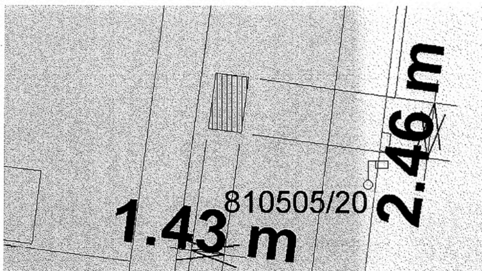
Figura je v tomto případě složena ze čtyř bodů