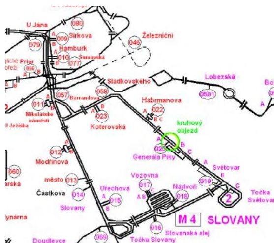
Obr. 1 Část schéma napájení měření

Při návrhu ochranných opatření se postupuje v souladu s ČSN EN 50122-2, ed.2 a analogicky s předpisem pro dráhu SR5/7(S) (1997), toho času před vydáním revize předpisu (2018) a v souladu s TP 124 (2009) MD ČR, který se považuje za platný i pro dráhy do doby vydání revize SR5/7(S) v návaznosti na ČSN EN 50162, příloha NA.