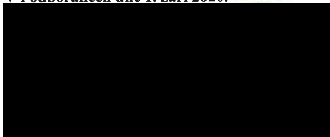
místostarosta Města Podbořany prodávající