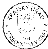
Razítko Středočeského kraje