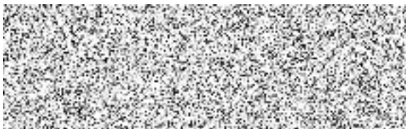
..... Lucie Zelníčková na základě plné moci