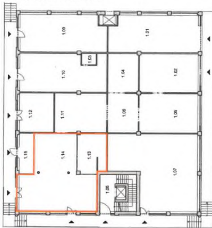
Schematický půdorys 1.NP