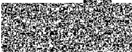
člen představenstva společnosti

MINISTERSTVO VNITRA ČR Policejní prezidium ČR Správa logistického zabezpečení