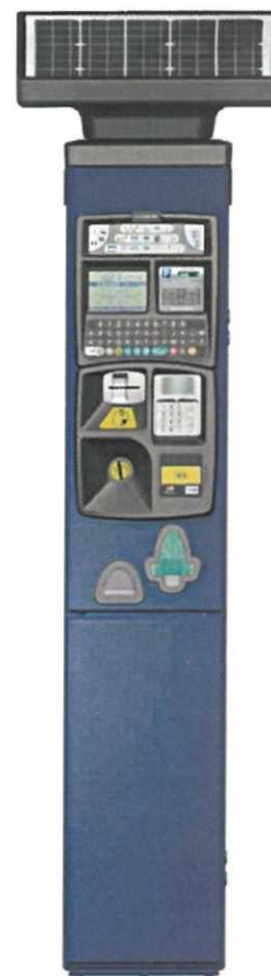
Obrázek je ilustrativní