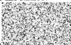
Městská část Praha 10